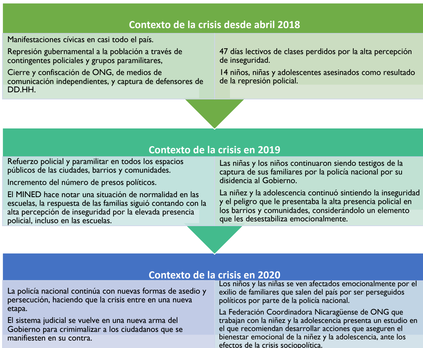
Figura 1: Evolución de la crisis sociopolítica de Nicaragua, desde 2018 a 2020.