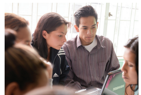
Des jeunes émigrés, déplacés à l'intérieur de leur pays, suivent un cours professionnel.