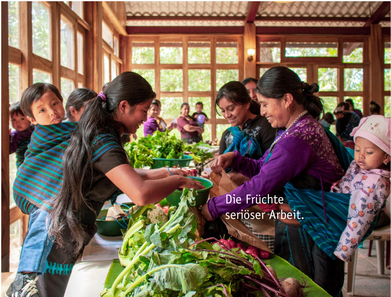
Die Früchte seriöser Arbeit.