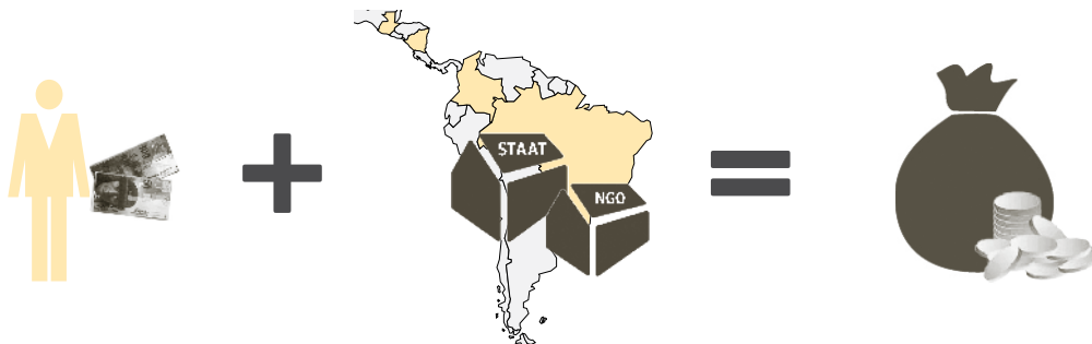
Spende in der Schweiz