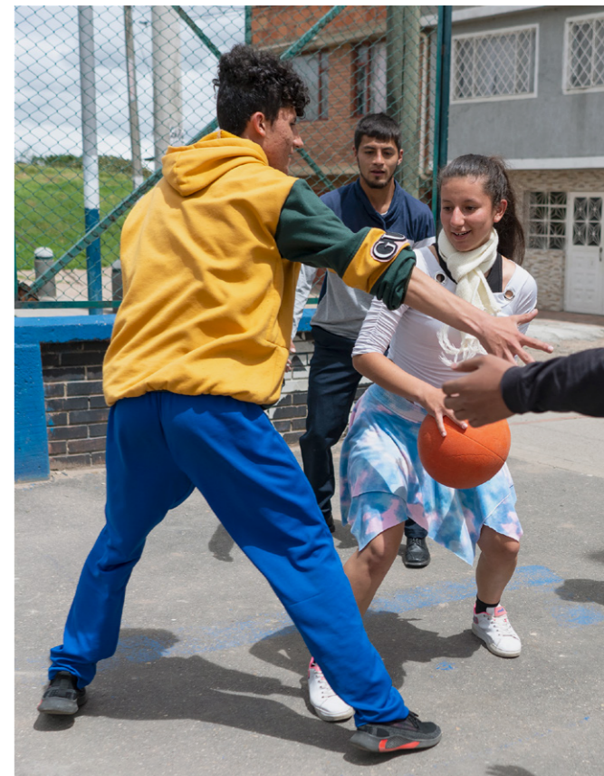
Projektteilnehmende spielen eine Partie Basketball in der Pause: Einmal in der Woche kommen sie zusammen und arbeiten an ihren Soft Skills.

“ PROGRAMME [DER BERUFSBILDUNG], DIE SICH NUR MIT DEN TECHNISCHEN STANDARD- FÄHIGKEITEN BEFASSEN, REICHEN NICHT AUS, DEN LEBENS- WEG GEFÄHRDETER JUGENDLICHER ZU VERBESSERN. AUCH DIE FÖRDERUNG DER PSYCHISCHEN GESUNDHEIT IST UNERLÄSSLICH. ”